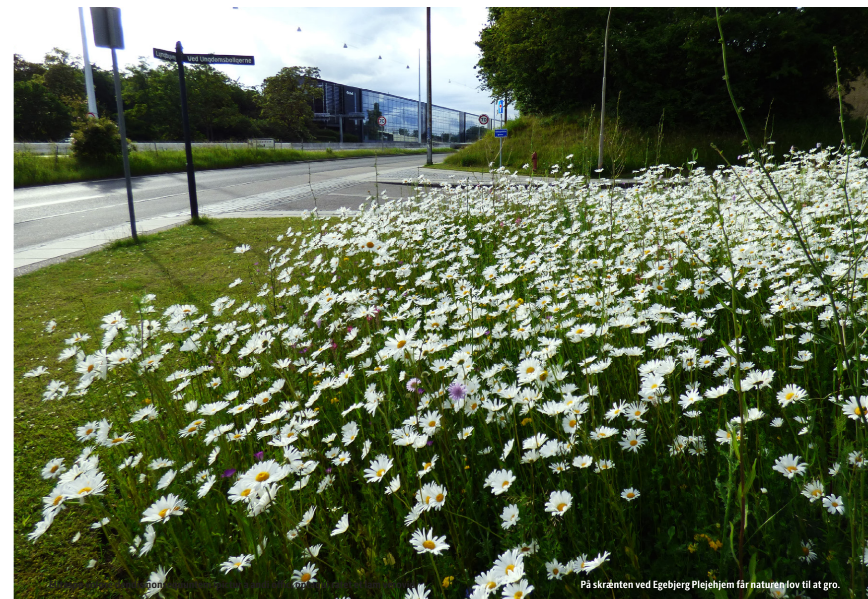
På skrånningen ved Egebjerg Plejehjem får naturen lov til at gro.

Læs mere på baeredygtigtgentofte.dk . Du kan også lytte til podcasten Klimakrisen set fra Gentofte, hvor du blandt andet kan blive klogere på, hvorfor vand er den største klimarisiko i Gentofte, og hvad vi kan gøre ved det. Find den på gentofte.dk/podcast22 eller der, hvor du plejer at lytte til podcasts. ■