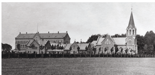
Øverst: Olga Hougaard tænder op til julemiddag i 1937.

Du kan høre meget mere om lokale kvindeskikkelser, når Gentofte Lokalarkiv er medarrangør på 'Dronningerunden', en kvindehistorisk bustur, som tager dig med igennem fire kommuners kvindefortællinger. Busturen finder sted den 10. september, som en del af Golden Days festivalen. Se mere på goldendays.dk/nord .