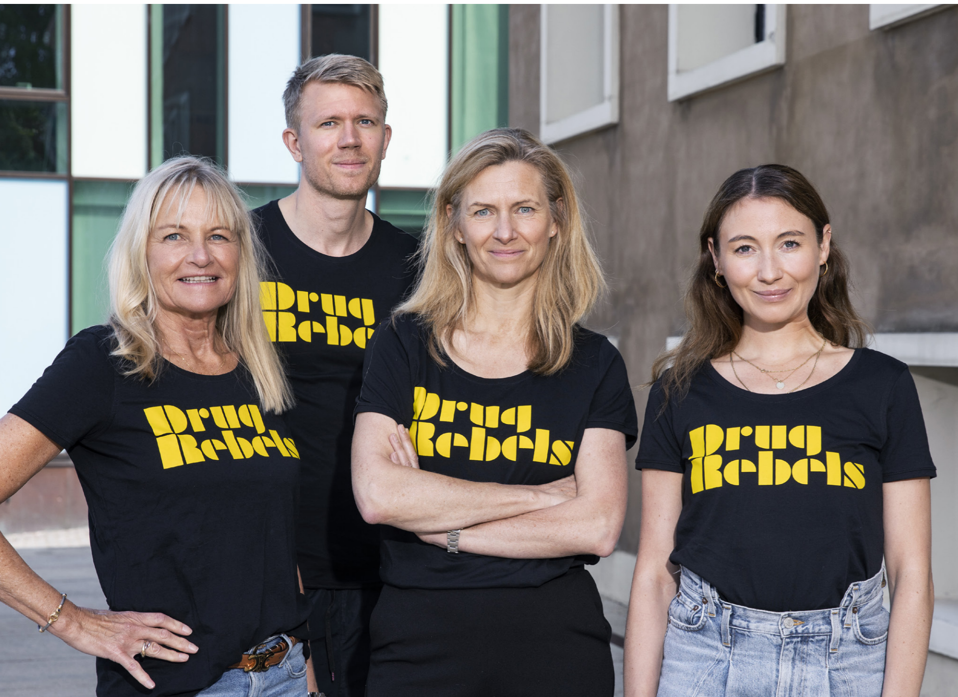
DrugRebels er en frivillig forening, der taler med de unge om, at de altid har et valg – også når det gælder stoffer.