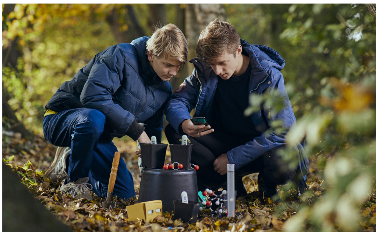
I et LIFE forløb kan eleverne blandt andet arbejde med udfordringen med at brødføde en voksende verdensbefolkning på en bæredygtig måde.

LIFE Fonden er en dansk erhvervsdrivende fond med almennyttigt sigte. LIFE Fonden har to formål; at højne den naturvidenskabelige dannelse, uddannelse og forskning og at styrke motivation og interesse for naturvidenskab hos børn og unge. Læs mere på life.dk ■