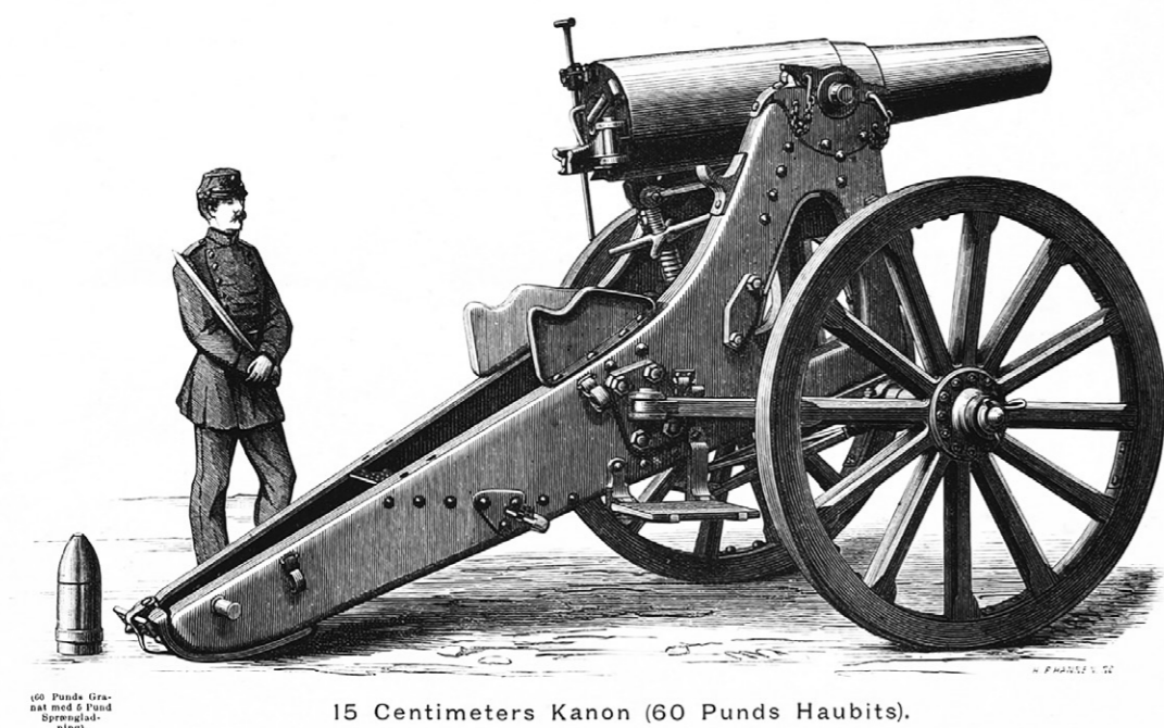
15 Centimeters Kanon (60 Punds Haubits).

Golden Days Festivalen sætter i år fokus på QUEENS – kvinder, køn og magt. Festivalen kører fra den 2. til den 18. september, og på Garderhøj fortet kan du se mere til historien om Kanonkvinderne. Festivalprogrammet for Gentoft, Lyngby-Taarbæk, Gladsaxe og Rudersdal finder du på goldendays.dk/nord